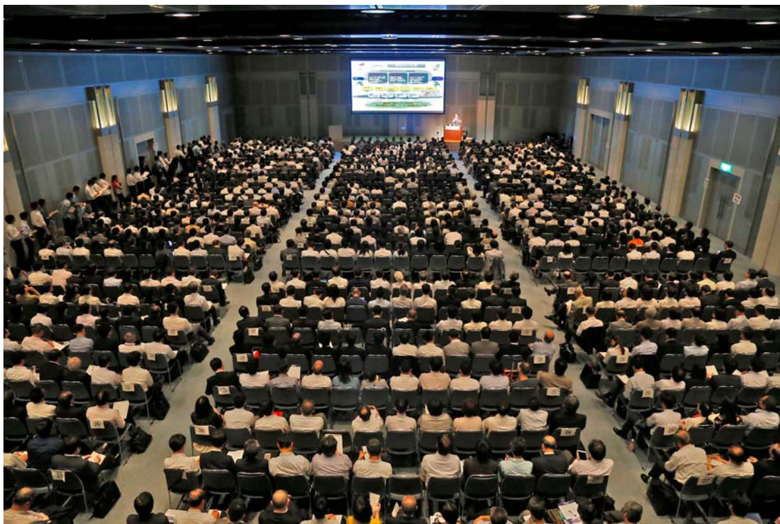
前回（2016年春）のセミナー会場風景